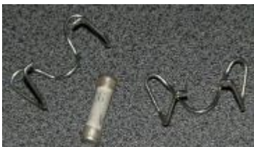
Предохранитель и фиксаторы;

Выбор места установки внутренней ванночки с датчиками: