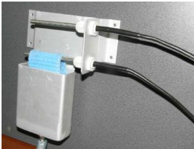
Внутренняя ванночка с держателем «сухого» и «влажного» термометров;