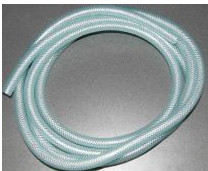
Силиконовая трубка для соединения внутренней и наружной ванночек длиной 3 м;