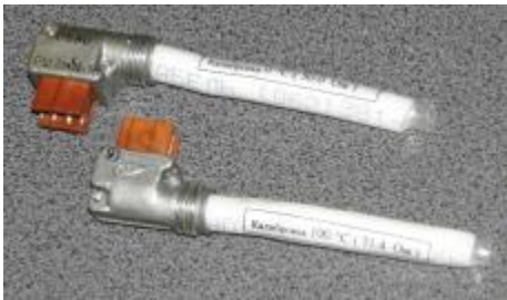
Реперные датчики температуры 0°C и 100°C;