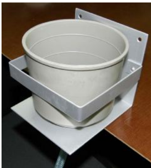
Наружная ванночка с держателем;