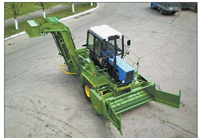
Свеклопогрузчик СПС 4-2А

Свекломойки также реализуют ООО «Группа компаний Техинсервис» (Киев, пер. Макевский, 1, тел. 8-044-251-1068), ОАО «Джуринский машиностроительный завод» (Джурин Винницкой обл., ул. Заводская, 1, тел. 8-04344-23177), ОАО «Купянский машиностроительный завод» (Купянск Харьковской обл., ул. Комсомольская, 38, тел. 8-05742-55832).